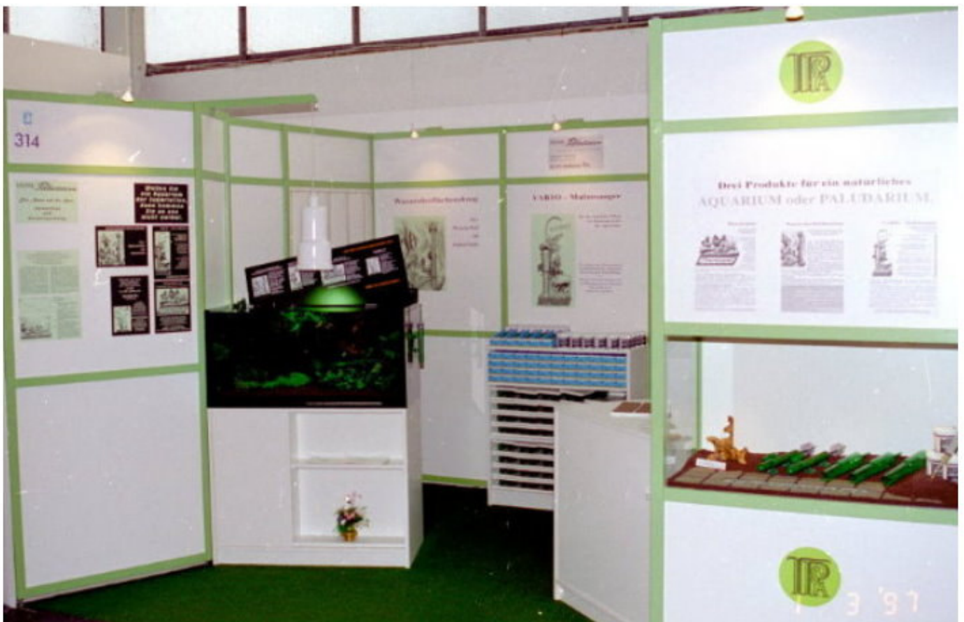
Heimtier und Pflanze in Berlin