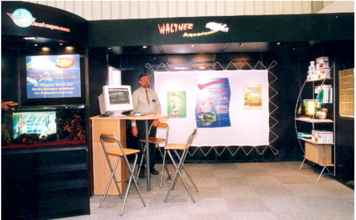
Interzoo in Nürnberg