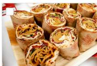
Vöner Kebab Mini-Wrap-Platte (vegan) mit veganem Vöner Kebab