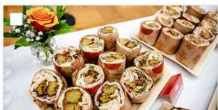
Falafel Mini-Wrap-Platte (vegan) mit hausgemachten Falafel