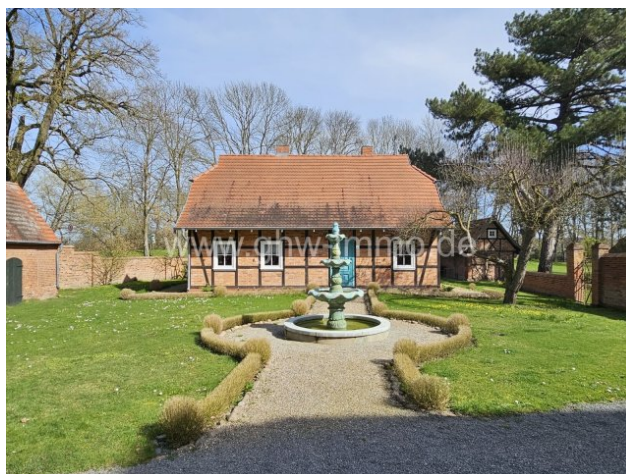
Büttnershof 38 Detailansicht