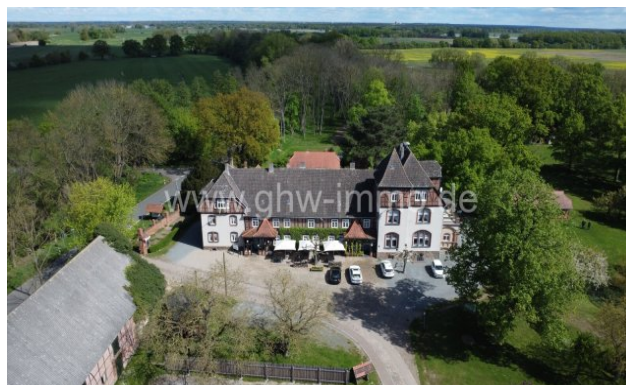
Büttnershof Gutshofsanwesen mit Umgebung

Mit seiner historischen Architektur, den großzügigen Veranstaltungsräumen und der malerischen Landschaft ist diese Immobilie ein echtes Juwel. Wenn Sie auf der Suche nach einer exklusiven und vielseitigen Immobilie sind, dann sollten Sie sich diese Gelegenheit nicht entgehen lassen!