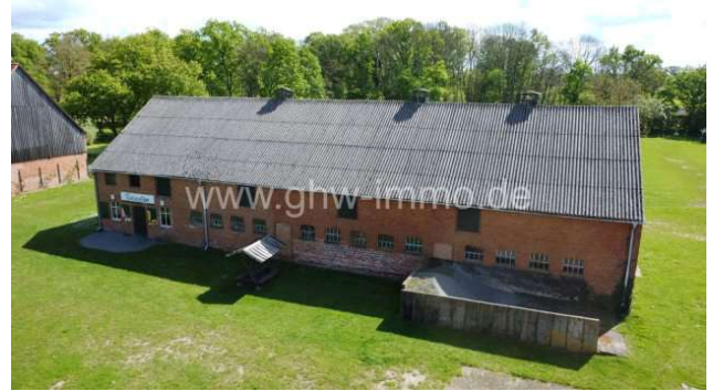
Ausschank mit angrenzenden Pferdeställen

Auf Wunsch empfehlen wir Ihnen Finanzierungsexperten. Weitere Unterlagen zum Objekt auf Anfrage.