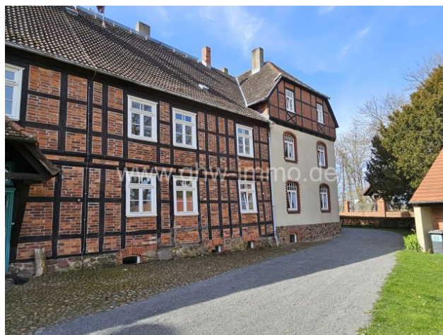
Büttnershof 38 Rückseite