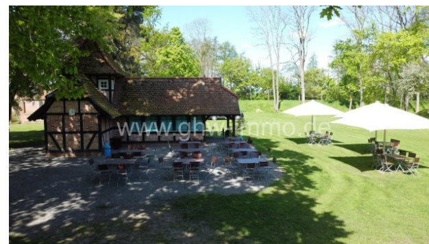
Pavillon mit Ausschank und Sitzplatzmöglichkeiten