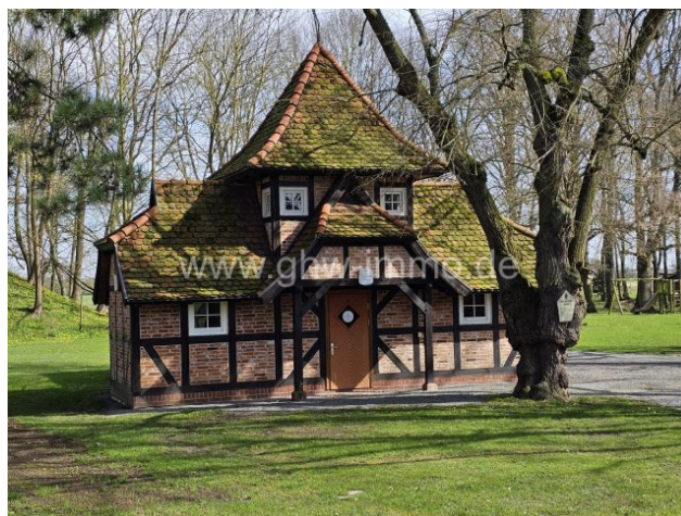
Nebengebäude mit Spielplatz im hinteren Bereich