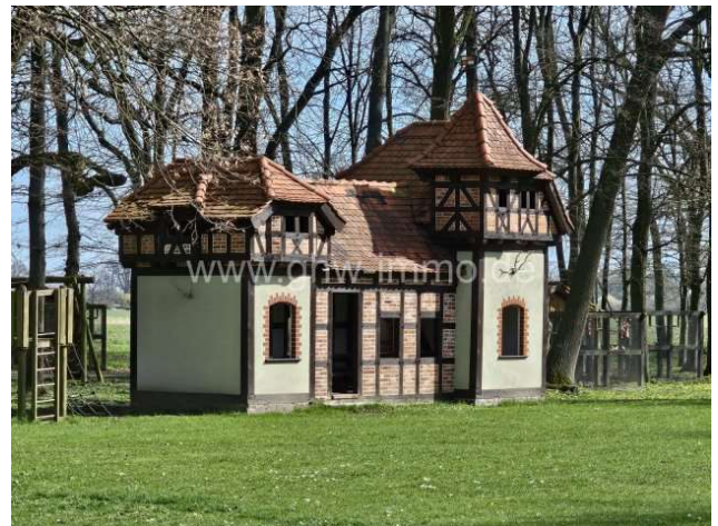
Modell Büttnershof für die kleinen Gäste