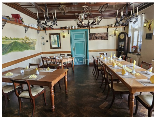
Blick in die Jägerstube

Das Objekt ist vollständig ausgestattet und kann sofort übernommen werden. Sämtliches Inventar, Marketing und auch die Betriebsmittel (Homepage) sind bereits im Kaufpreis enthalten.